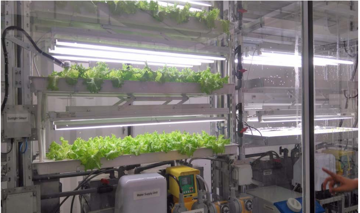
Granja Fujitsu en Hanoi, Vietnam (2016).

estas compañías han construido sólo ocupan, en todo el mundo, el equivalente a unas escasas 30 hectáreas de tierra. 1 Difícilmente es un factor de cambio para la producción global de alimentos.